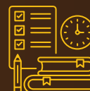
Persiapan Ujian Sertifikasi Manajemen Risiko