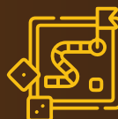
Risk Management Game-Based Simulation