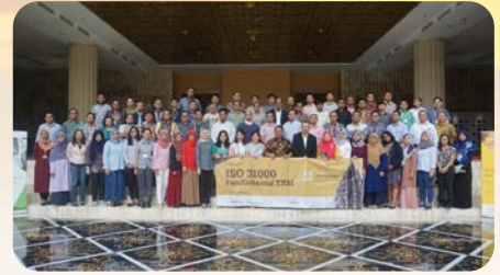
ISO 31000 Series 1: ERM Fundamentals, 3-7 Desember 2018, Hotel Tentrem, Yogyakarta

Dua hari selanjutnya, peserta dapat semakin memperkaya wawasan dan perspektif manajemen risiko dengan mengikuti konferensi internasional manajemen risiko terbesar se-Asia Tenggara, Risk Beyond 2019, yang kali ini mengangkat tema "Risk Management: The Next Generations - Embracing GRC in Industry 4.0" .