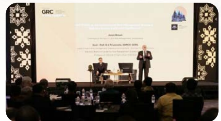
Risk Beyond 2018, 6-7 Desember 2018, Hotel Tentrem, Yogyakarta