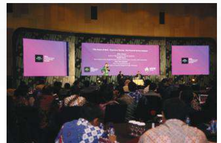
Risk Beyond 2017, 7-8 Desember 2017, The Alana Hotel and Convention Center, Yogyakarta