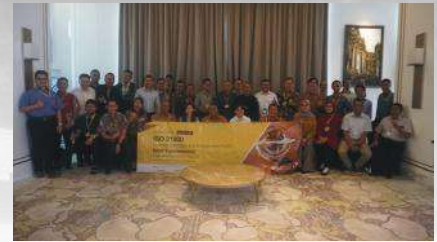
ISO 31000 Series 1: ERM Fundamental, 4-6 Desember 2017, The Alana Hotel and Convention Center, Yogyakarta

Dua hari selanjutnya, peserta dapat semakin memperkaya wawasan dan perspektif manajemen risiko dengan mengikuti konferensi internasional manajemen risiko terbesar se-Asia Tenggara, Risk Beyond 2018 , yang kali ini mengangkat tema " Integrated GRC (Governance, Risk Management, Compliance) in a New Digital World. "